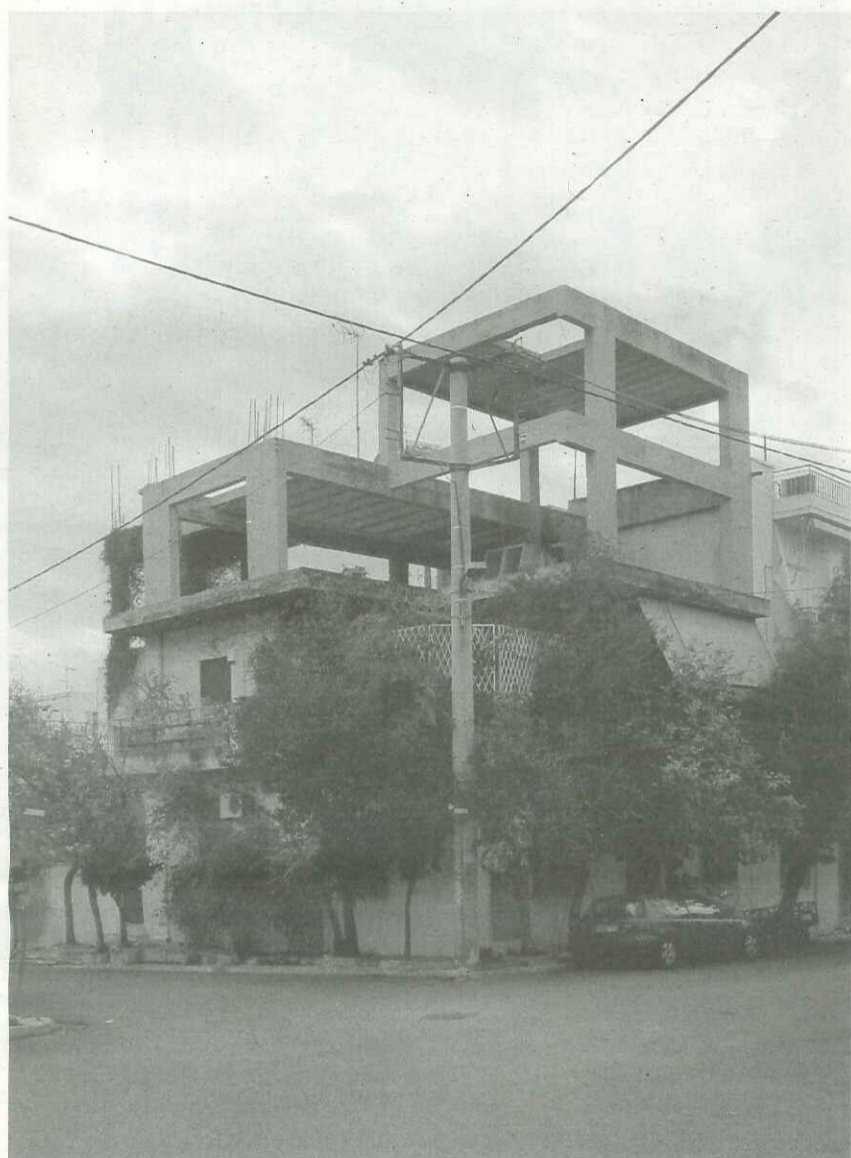
morphological typology: Upper level [UN] structure : multiple story / free standing / free form municipality: Vironas (greater Athena) address: Stratigou Rolou 10 & Dikaiarchou