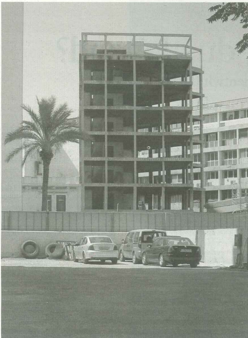
morphological typology : Full [UN] structure : multiple story / one side wall / addition of similar floors building permission : Δ4547/1966 function: hotel original civil engineer: Theofilos A. Goumenos original owner: Dorotheos Tsantilis current owner: Nafpaktia SA municipality: Athens address: Ag. Konstantinou 61 & Deligiorgi

Doorgaans koopt de projectontwikkelaar een kavel met een oud huis, sloopt dat, zet een appartementsgebouw neer en verschaft de oorspronkelijke bewoners als tegenprestatie het appartement op de bovenste verdieping – een procedure die heel gebruikelijk is in Athene.