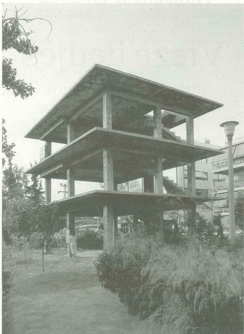
morphological typology: Full [UN] structure : multiple story / free standing / addition of similar floors municipality: P. Faliro (greater Athena) address: Praxitelous 7 & Amfitheas Avenue

wapend beton en daartussen kolommen die het gewicht dragen, de trap plaatste hij aan de buitenkant, zodat die ook niet in de weg zou kunnen zitten. Je kon Maison Dom-ino indelen zoals je wilde en er elke gevel tegenaan plakken, je kon er in feite alles mee, en dat is later ook wel gebleken. Het concept van Maison Dom-ino is de oergestalte van moderne architectuur, het hypersimplistische DNA ervan, de Platonische Idee, wereldwijd maar zeker ook in Athene, dat vooral in de jaren zestig en zeventig buitensporig groeide en vrijwel geheel uit eender geconstrueerde appartementsgebouwen bestaat – zou je er alle gevels slopen, dan zou je eindeloos vermenigvuldigde en gestapelde Maison Dom-ino's overhouden, een woekering ervan, allang niet eenvoudig en overzichtelijk meer, maar een onafzienbaar betonnen skelettenlabyrint, in uitgestrektheid alleen vergelijkbaar met door schel-