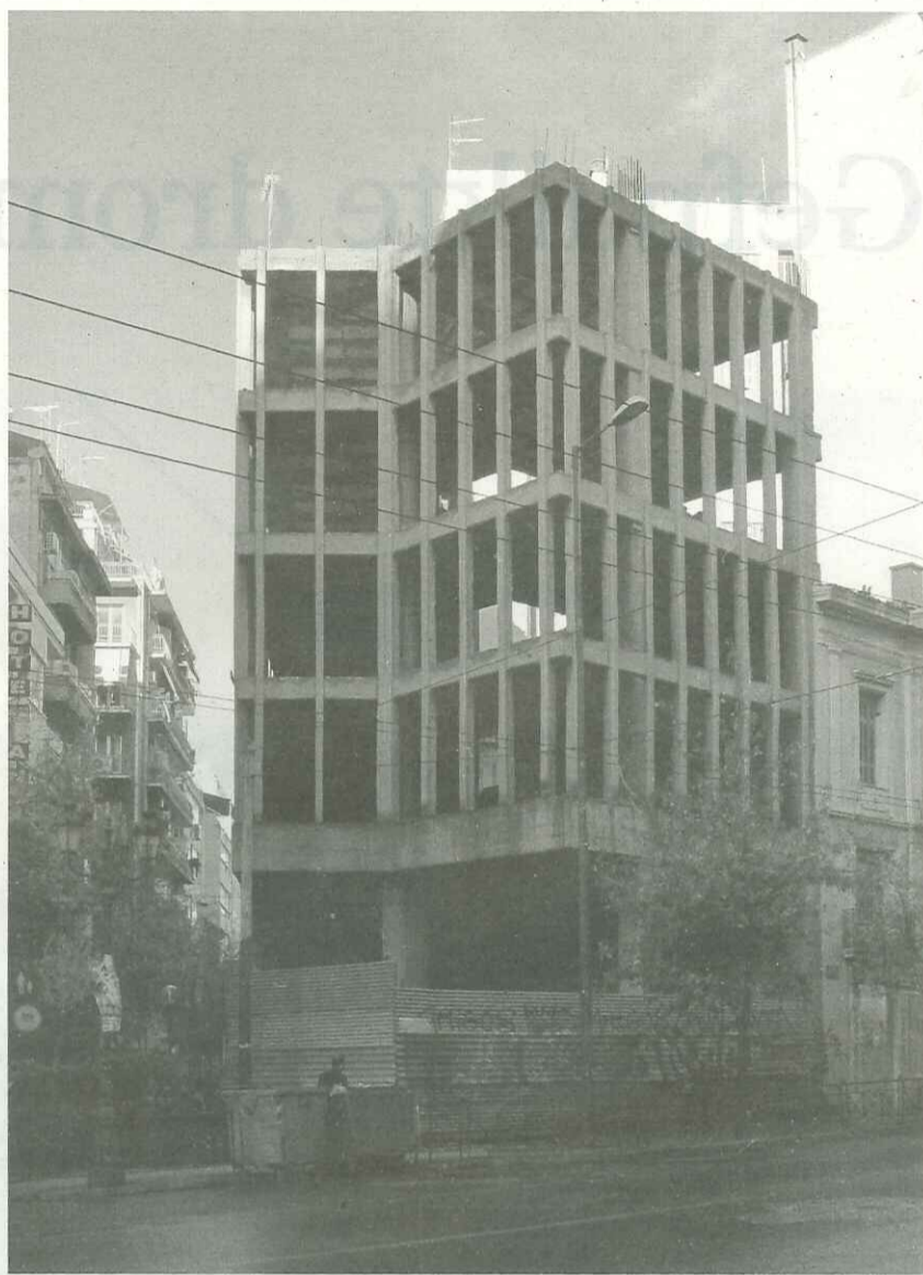
morphological typology: Full [UN] structure : multiple story / two side walls - corner / addition of similar floors municipality: Athena address: Panagi Tsaldari 26

Eigenlijk vormen de constructies variaties op Le Corbusiers Maison Dom-ino. Hoe eenvoudig ook, het Maison Dom-ino werd nooit uitgevoerd, behalve, in hout, op de architectuurbiënnale in Venetië van dit jaar. Om goedkope, flexibele woningbouw mogelijk te maken tekende de visionair twee vloerplaten van ge-